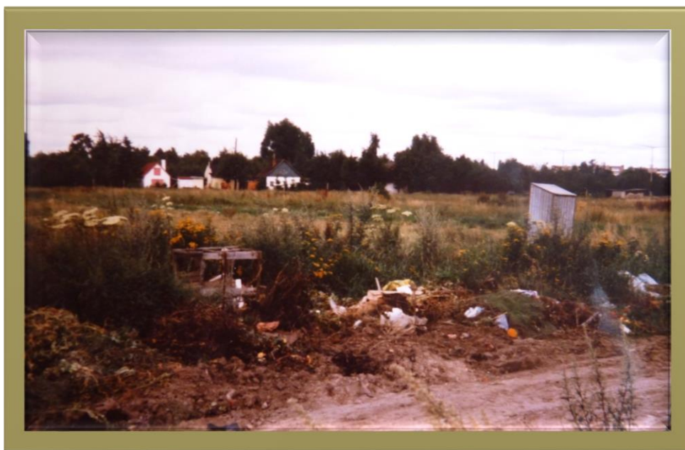
Baugebiet für KgV Im stillen Frieden Neuanlage Teil 2; Nördlich der Tannenbergsstraße März 1977