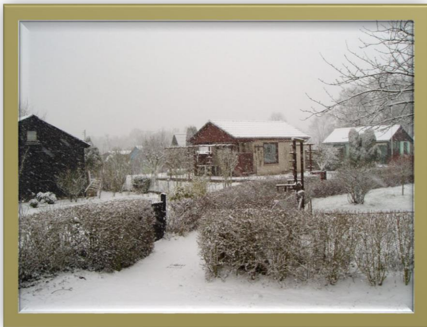
Feuerdornweg Frühjahr 2014