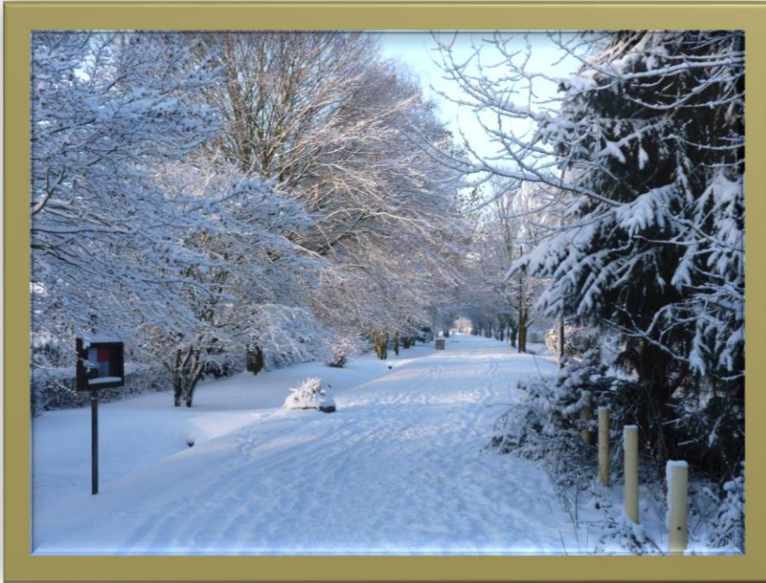
Tannenbergstraße Winter 2010