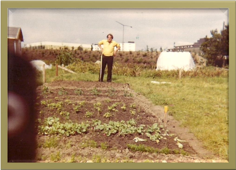
Erste Anpflanzung im Ergebnis 1979