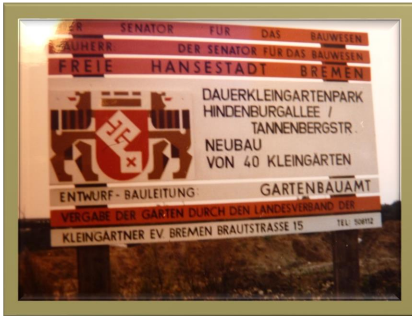
Baustellenschild für KgV Im stillen Frieden Neuanlage Teil 1; Südlich der Tannenbergsstraße März 1977