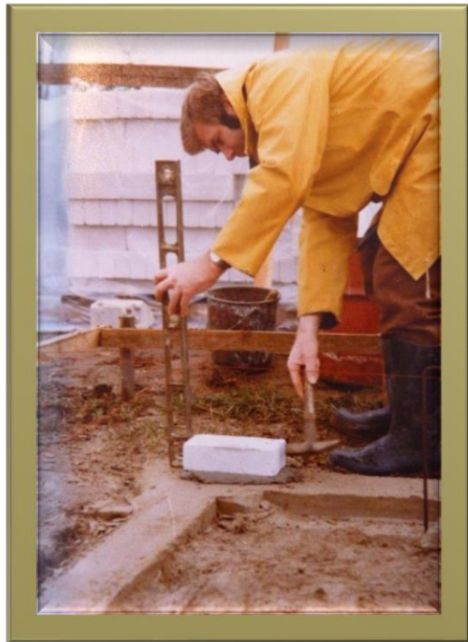
Am Anfang gab es die Grundsteinlegung 1975