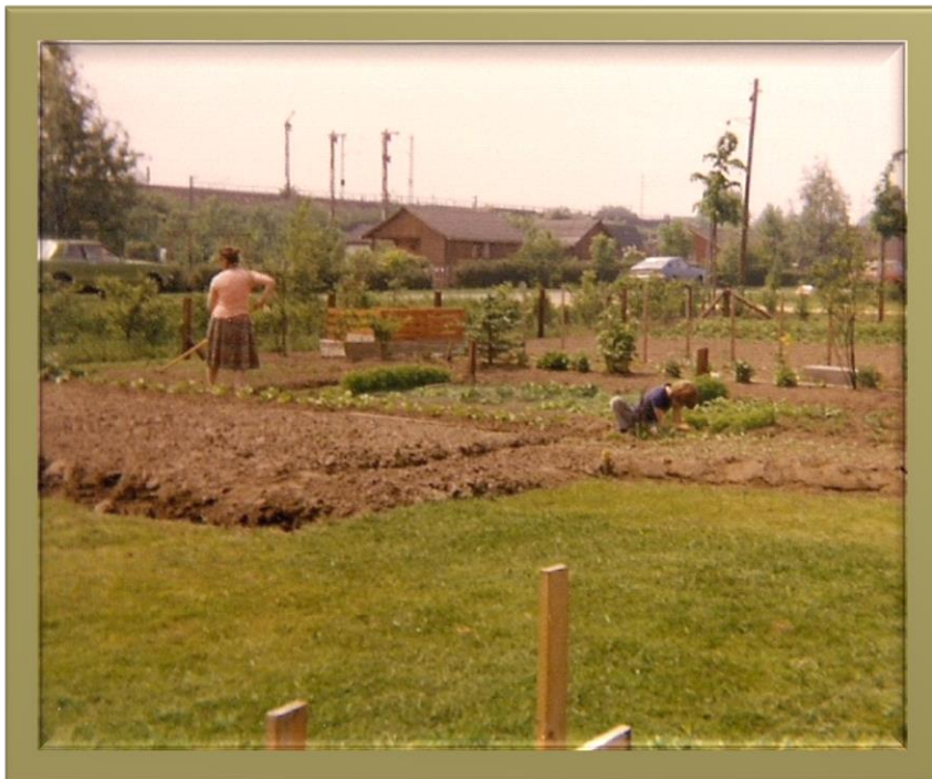
Erste Anpflanzungen 1979