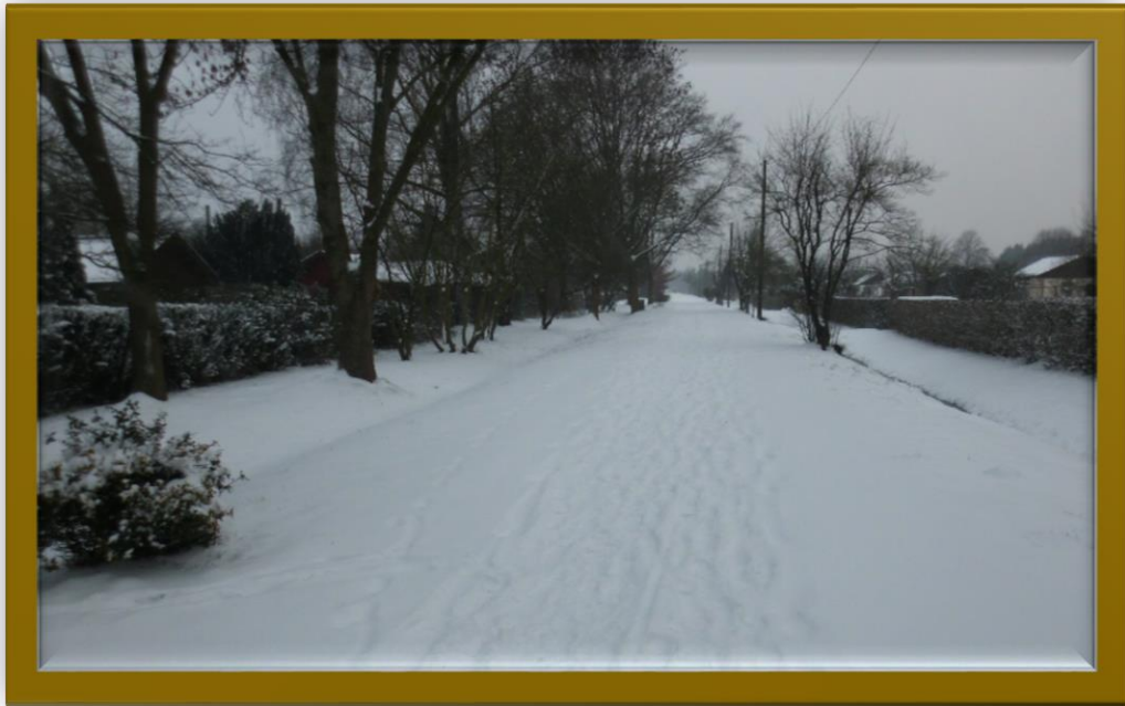
Tannenbergstraße in Richtung Stadtmitte Januar 2016