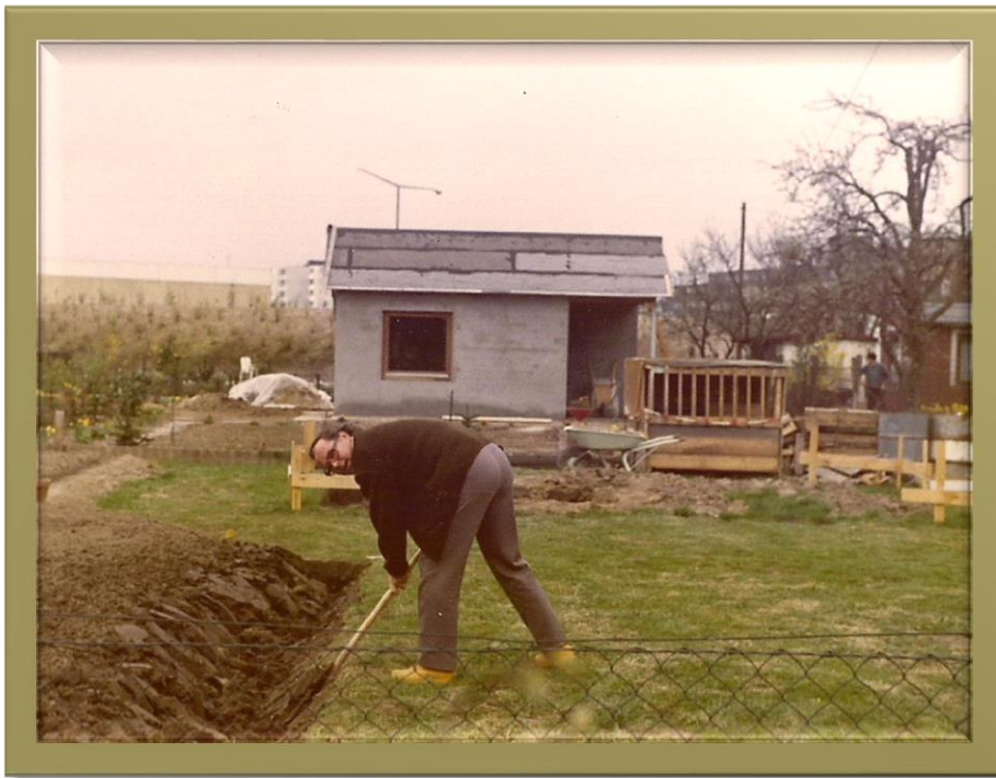
Umgraben und Umgraben ... 1979