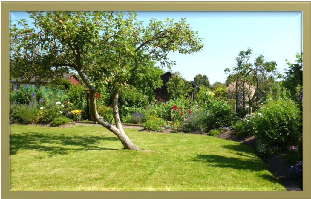
Kleingarten in Richtung Osten gesehen