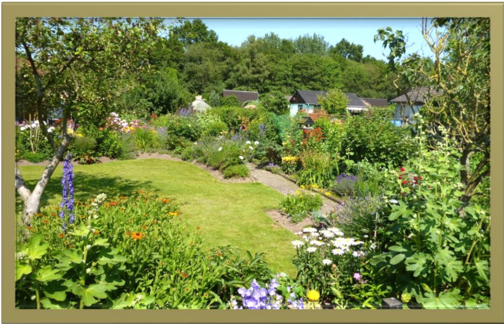
Kleingarten in Richtung Norden gesehen