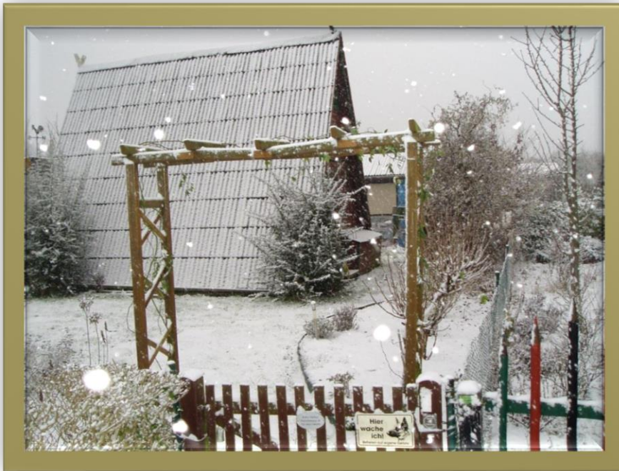
Nurdachlaube am Feuerdornweg Frühjahr 2014