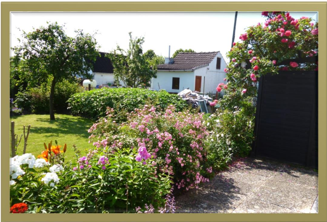
Kleingarten in Richtung Westen gesehen