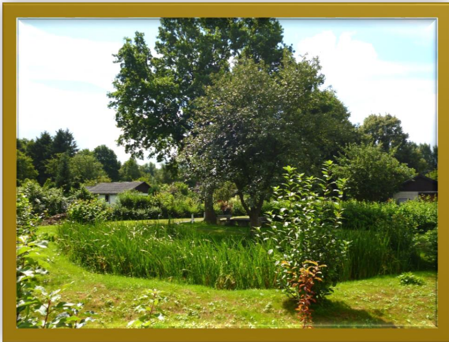
Ententeich am Feurdornweg Juli 2016