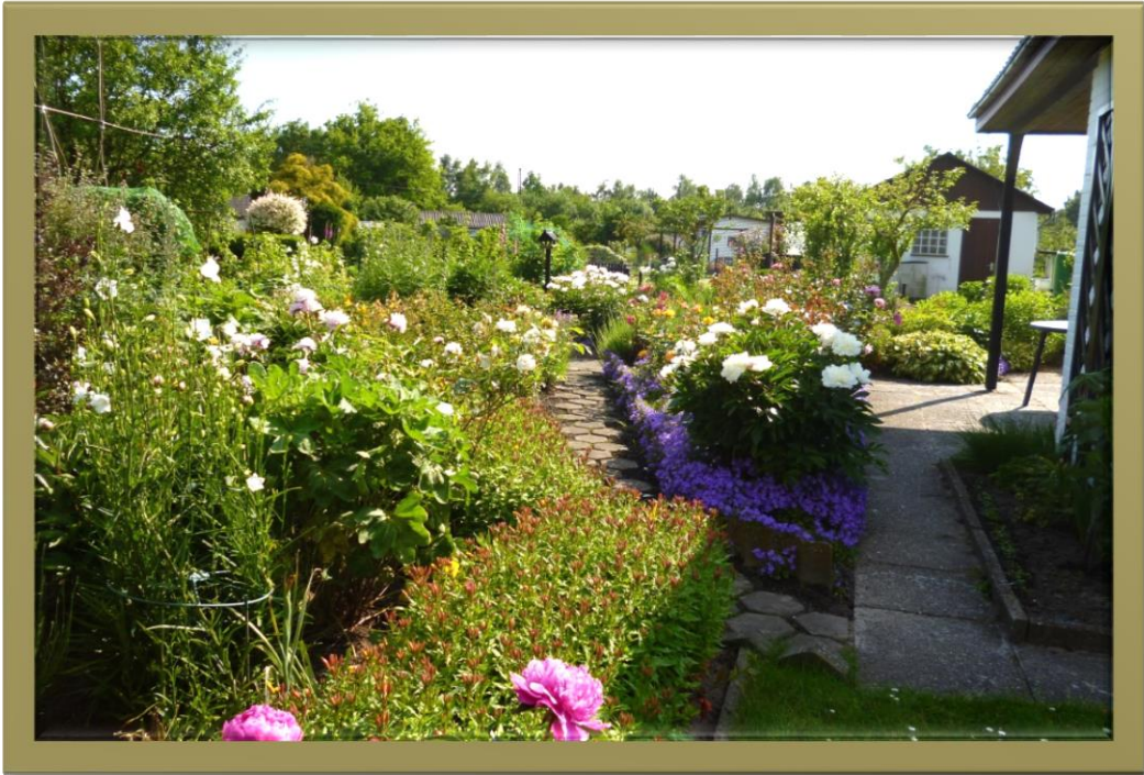
Kleingarten in Richtung Süden gesehen