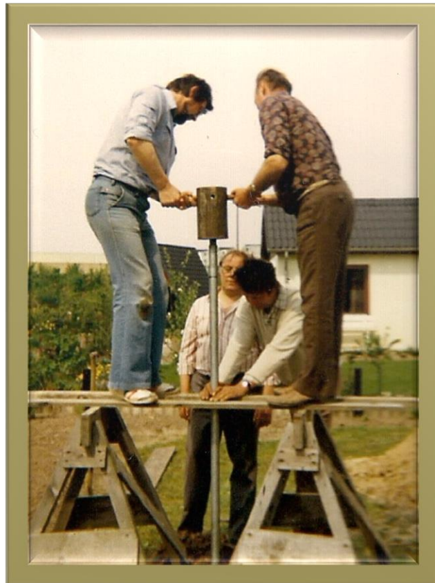
Gemeinsames Pumpenrohrschlagen 1980