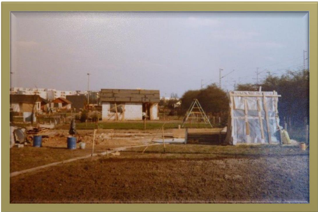
Die Baustelle des Kleingartens 1975