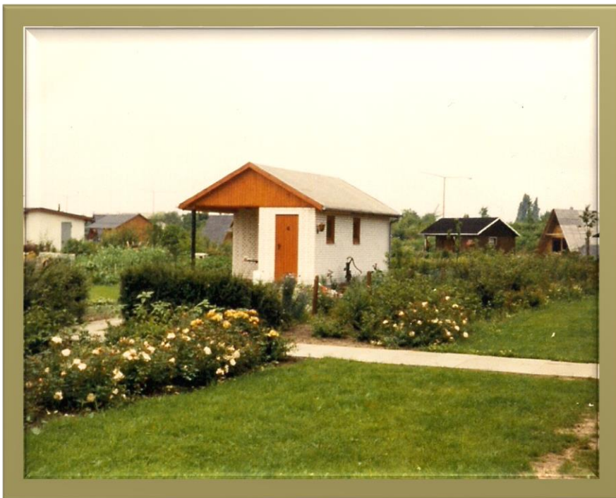
Parzellen am Feuerdornweg in Richtung Ententeich