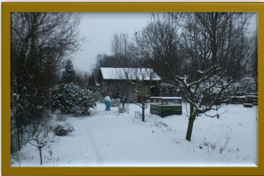
Winterzeit in der Neuanlage Januar 2016