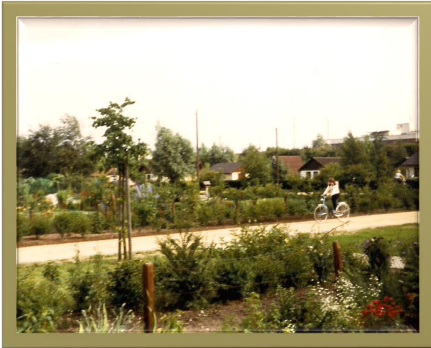
Beginn des Feuerdornwegs