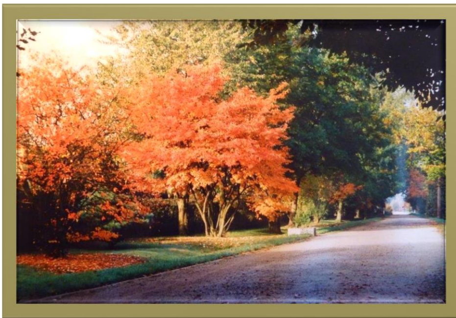
Tannenbergstraße Herbst 1994