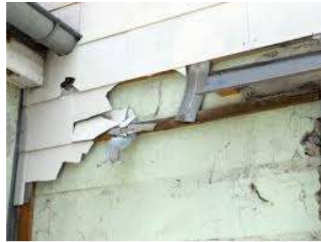
Plattenernit auf Wandflächen