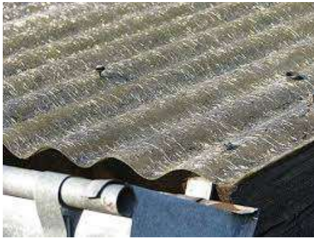
Wellenernit auf Dächern